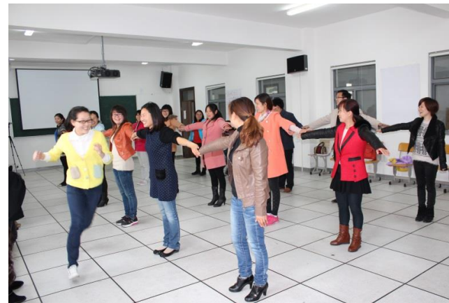
(上海) 游戏是提高学生参与兴趣的重要方式