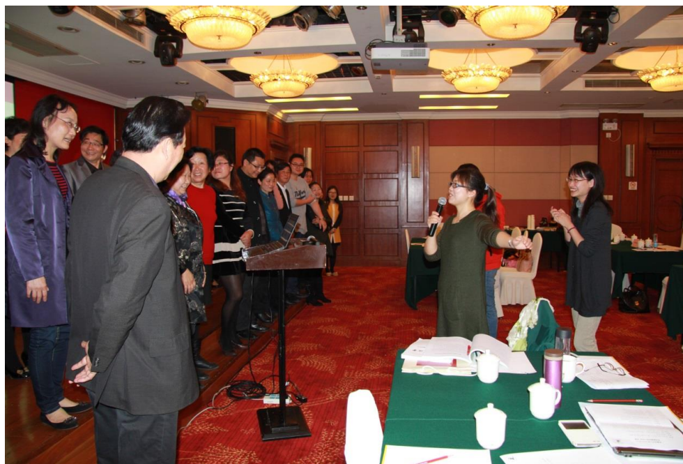
参加健康促进工作坊的专家、校长和老师