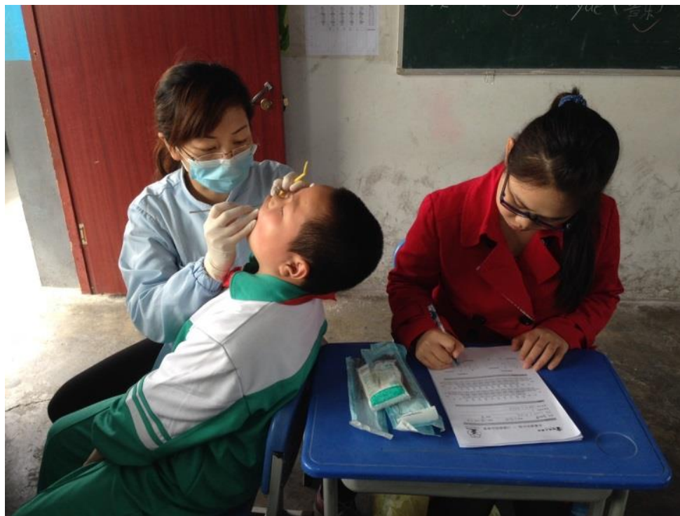
医生为学生进行口腔检查

2014 年 3 月 31 日至 4 月 2 日，乐童项目邀请上海市口腔医院的医生为嘉定区五所项目学校（民办中村小学、民办桃苑小学、民办娄塘小学、民办仓场小学、民办天宇小学）近 500 名四年级学生提供了免费的口腔检查，对学生口腔健康状况有了更细致的了解，为后期干预活动设计提供依据。