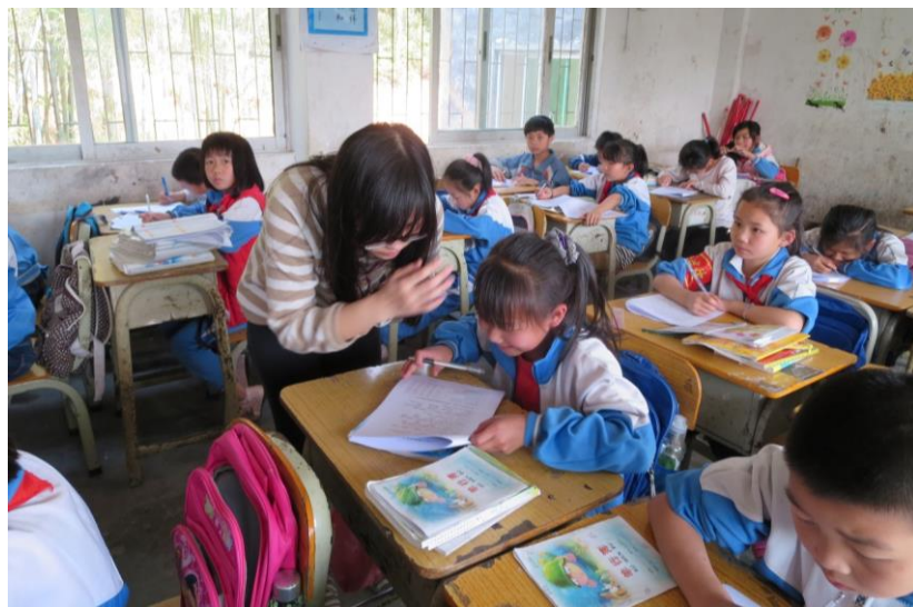
广州乐童项目工作人员分发调查问卷

此次调研旨在通过学生本人及其家長，了解学生的生长发育和健康状况、健康知识的掌握程度，以及日常健康行为习惯，为项目干预设计提供依据。