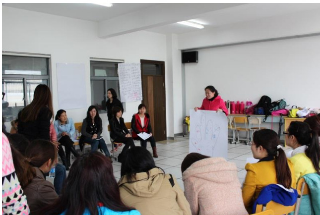
(上海) 老师们用画画的方式讲解洗手的重要性