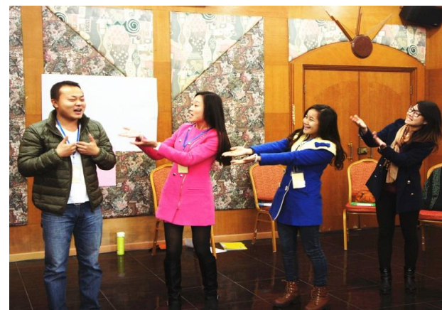
(广州) 互动游戏可以增加集体合作的热情