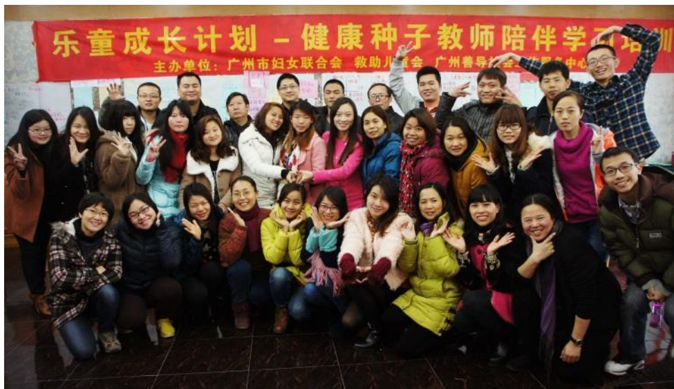
(广州) 参加培训的老师合影

两地的教师培训都希望通过多元艺术方法的培训，推动教师在学校开展生动、有趣、以儿童参与为主的健康教育课和学生活动，促进学生在健康知识、态度和行为上的改变。