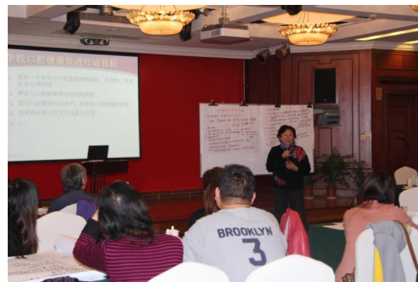
健康促进计划分享

新闻链接： http://www.savethechildren.org.cn/node/912#