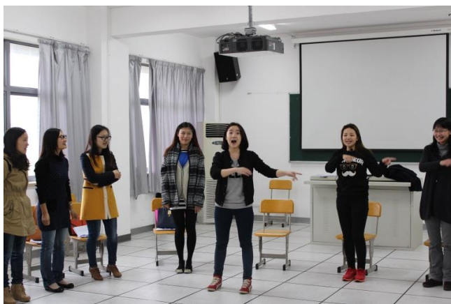
(上海) 用肢体语言进行自我描述是一件开心的事情